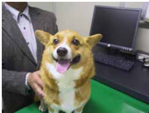
元気になったコーギー